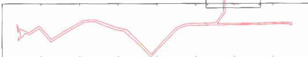
VÝKRES č. 1

BRATISLAVA 7-0/33 BRATISLAVA 7-0/34 BRATISLAVA 7-1/11 BRATISLAVA 7-1/12