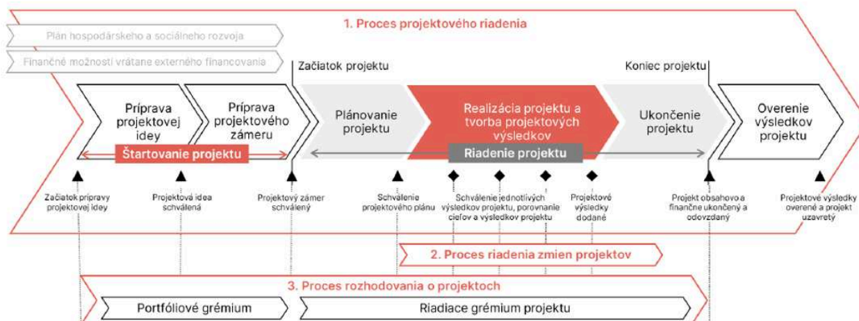
Obrázok č.1: Životný cyklus projektu (proces projektového riadenia)

Smernica k projektovému riadeniu ďalej definuje metodiku k vypracovaniu Matice zodpovednosti (tzv. RACI matica), ktorá vymedzuje kompetencie osôb z tímu za konkrétne projektové výsledky. Je povinným nástrojom v prípade projektov zaradených do Kategórie A+/A.