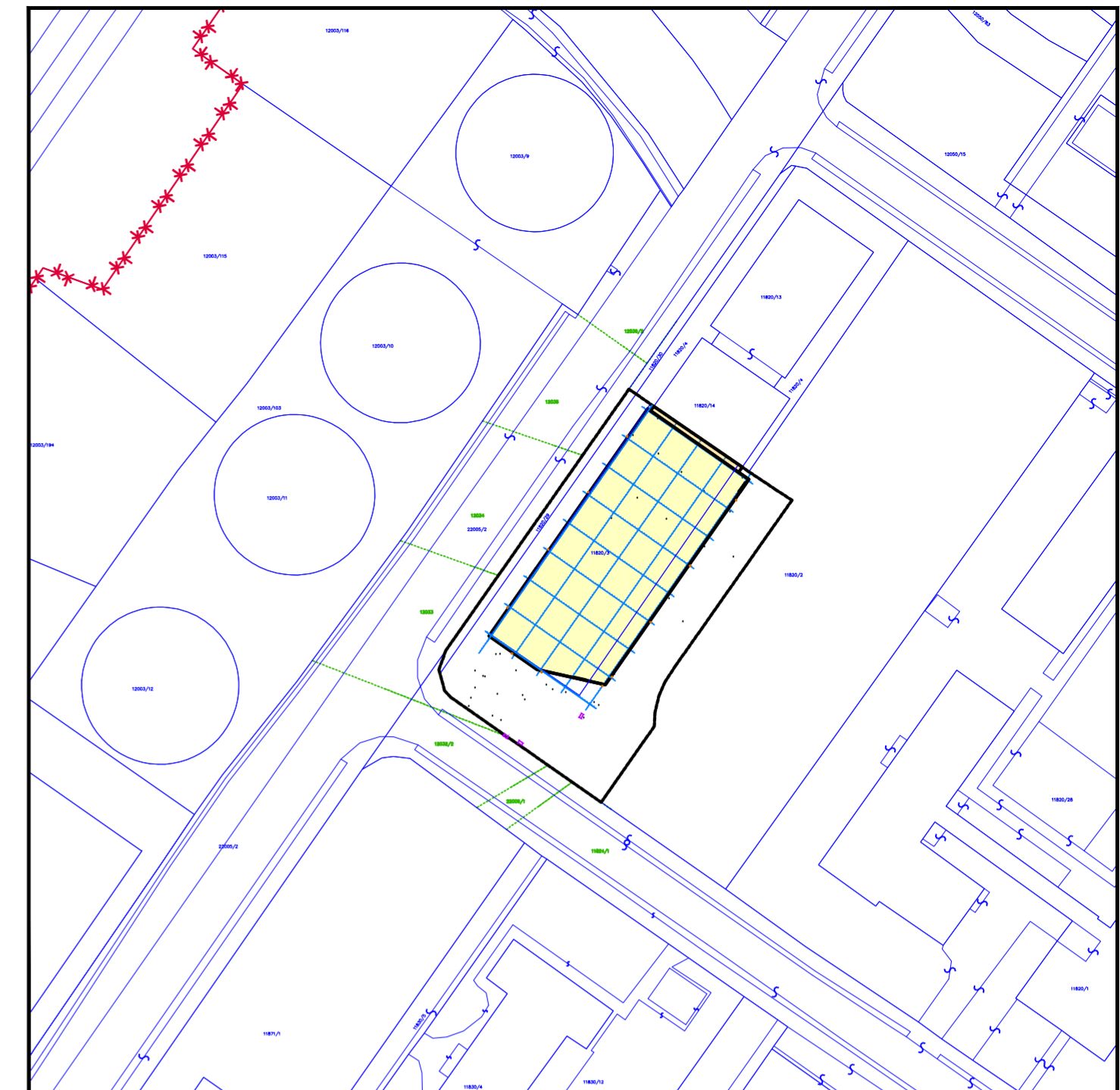
SITUÁCIA ŠIRŠÍCH VZŤAHOV M 1:1000