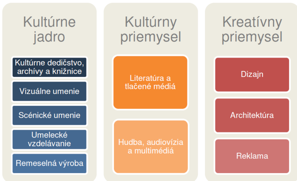
Schéma 1: Prehľad odvetví kultúrneho a kreatívneho priemyslu podľa aktuálnej definície

Na základe metodiky KEA, UNESCO a ESSnet-Culture vznikla definícia odvetví v rámci kultúrneho a kreatívneho priemyslu, ktorú sa bude používať ako základné východisko pre poskytovanie centralizovanej aj decentralizovanej podpory v rámci prioritnej osi 3 Integrovaného regionálneho operačného programu. A zároveň Ideový rámec prepojenia kultúry a kreatívneho priemyslu pre detailnejšie objasnenie problematiky.