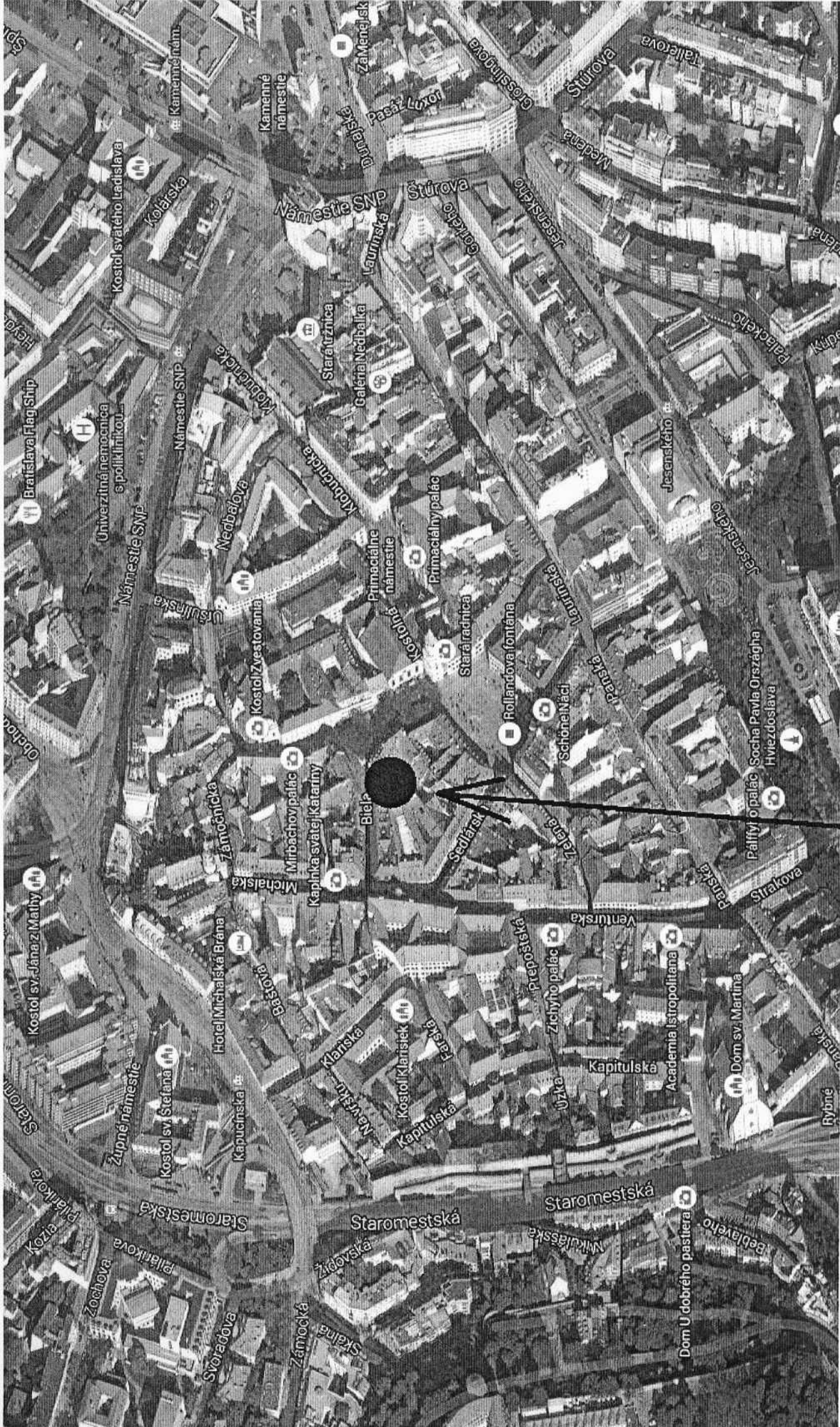
p.č. 21 k.ú. Staré Mesto