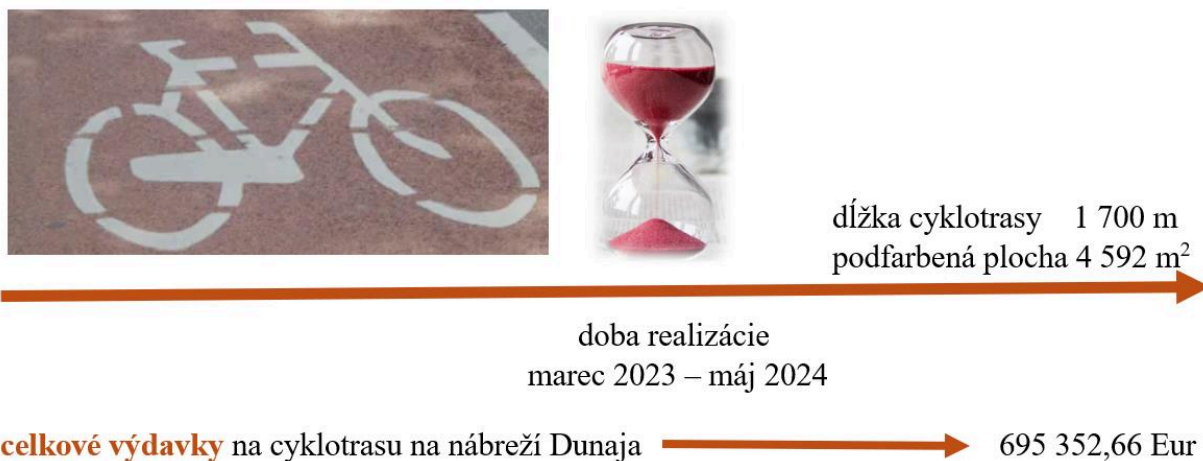
Obrázok č. 2: Zhodnotenie zrealizovanej cyklotrasy podľa rozsahu, výdavkov a doby realizácie