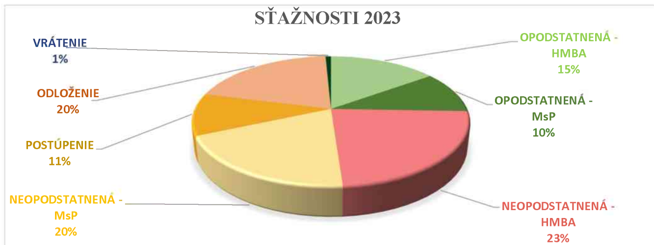
Graf č. 2 – Vybavenie sťažností hlavným mestom za rok 2023