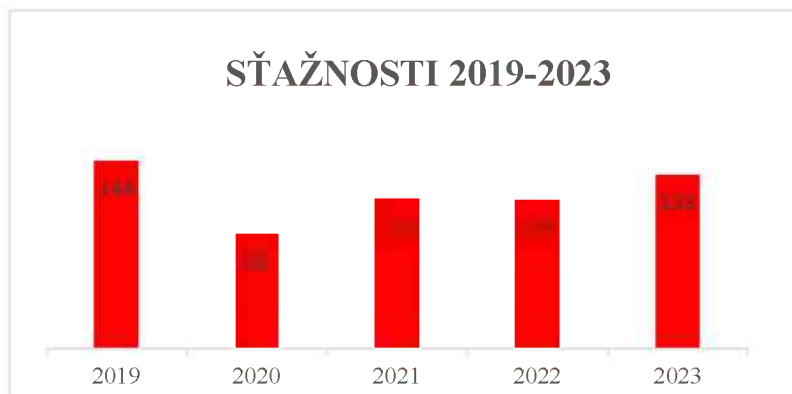
Graf č. 1 – Počet prijatých sťažností hlavným mestom za obdobie 2019-2023