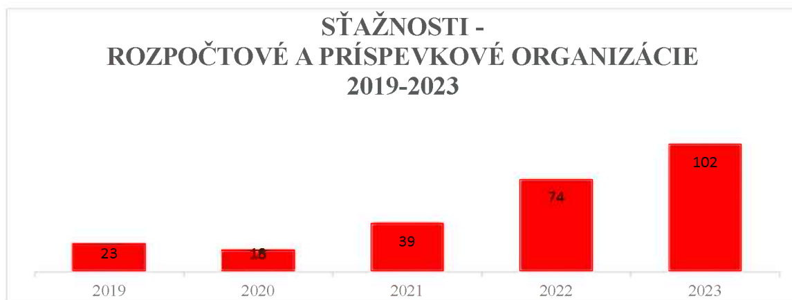
Graf č. 5 – Počet prijatých sťažností v rozpočtových a príspevkových organizáciách hlavného mesta SR Bratislavy za obdobie 2019-2023