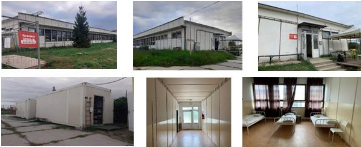
Obr. – Mestské karanténne zariadenie – Krízové ubytovanie

Dvouch klientov sa podarilo umiestniť do ZPS Pri Kríži, jednu klientku do ZPS Lamač, dvoch klientov do zariadenia dlhodobého bývania Domov pre každého. Šiestemu klientovi sme zabezpečili ubytovanie v zariadení Resoty, no klient z osobných dôvodov do tohto zariadenia nenastúpil. Krízové ubytovanie pre ľudí bez domova, ako rozšírená funkcia MKZ, bolo zo strany poskytovateľov sociálnych služieb pre ľudí bez domova vnímané veľmi pozitívne, a zároveň hlavné mesto v plnej miere využilo svoje významné postavenie v štruktúrach verejnej správy, čo malo podstatný vplyv na procesy súvisiace s umiestňovaním ľudí do zariadení sociálnych služieb.