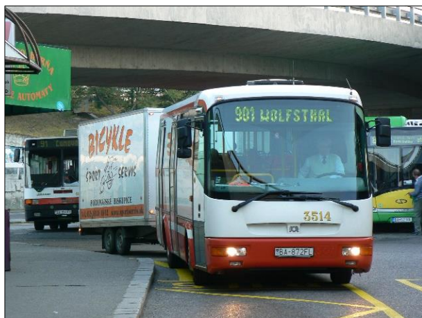
Prvý spoj linky 901

Geografická poloha mesta Bratislava, na styku štátnych hraníc troch štátov začlenených do Európskej únie a Schengenského priestoru, je veľkou výzvou pre zabezpečenie dostupnosti celého jeho bezprostredného okolia verejnou osobnou dopravou. Kvôli unikátnemu priestorovému usporiadaniu hraníc štátov a administratívnych celkov dlhý čas nebolo jednoznačne dané, koho úlohou je objednávanie výkonov vo verejnom záujme prímestskej autobusovej dopravy na zabezpečenie spojenia medzi hlavným mestom Slovenska a prihraničnými obcami v Rakúsku, ktoré nemajú žiadne spojenie so Slovenskom železničnou dopravou. Pre úplnosť pripomenieme, že táto problematika sa dotýka aj spojenia mesta Bratislava s obcou Rajka v Maďarsku, ale predložený dokument sa venuje prioritne spojeniu medzi Bratislavou a obcami v Rakúsku.