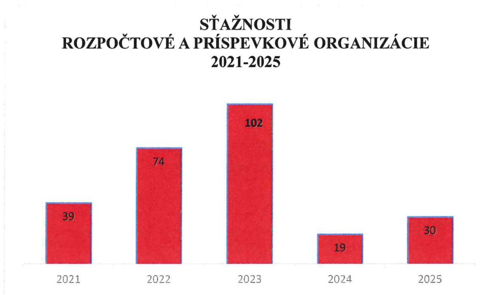
Graf č. 5 – Počet prijatých sťažností v rozpočtových a príspevkových organizáciách hlavného mesta SR Bratislavy v rokoch 2021 - 2025