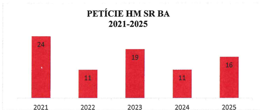
Graf č. 3 – Počet petícií doručených hlavnému mestu v rokoch 2021-2025