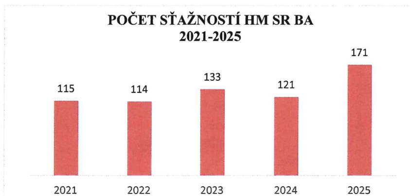
Graf č. 1 – Počet sťažností doručených hlavnému mestu v rokoch 2021-2025