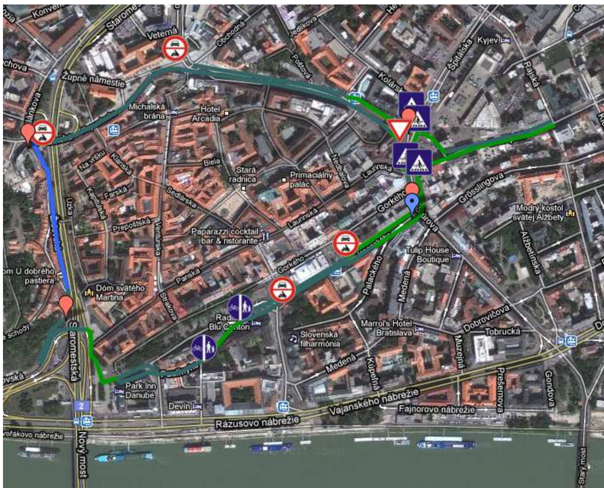
Obr. Prvý (historický) okruh, (Zdroj: Cyklokoalícia)