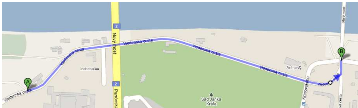
Obr: Trasa Viedenská cesta

Navrhované riešenie: Povolenie vjazdu pre cyklistov do protismeru od Starého mosta po Nový most (zobojsmernenie pre cyklistov, prípadne pre MHD), odstránenie zákazu vjazdu na nájazde na Starý most, zvislé a vodorovné značenie, spomaľovač, cyklopiktogramy, osadenie značky zákaz vjazdu áut nad 3,5 ton, a vzhľadom na to, že ide o oddychovú zónu stanoviť maximálnu rýchlosť 30 km/h. Rovnako navrhujeme zväziť obmedzenie parkovania na jednej strane s možnosťou náhradného parkovania pri Starom moste.