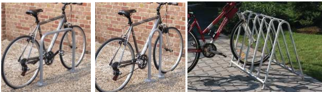
Obr. Ukážky navrhovaných cyklostanov.