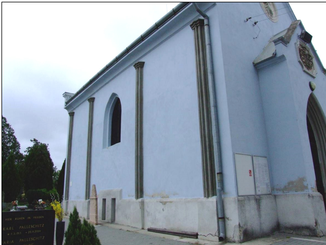
Bočný pohľad na kaplnku