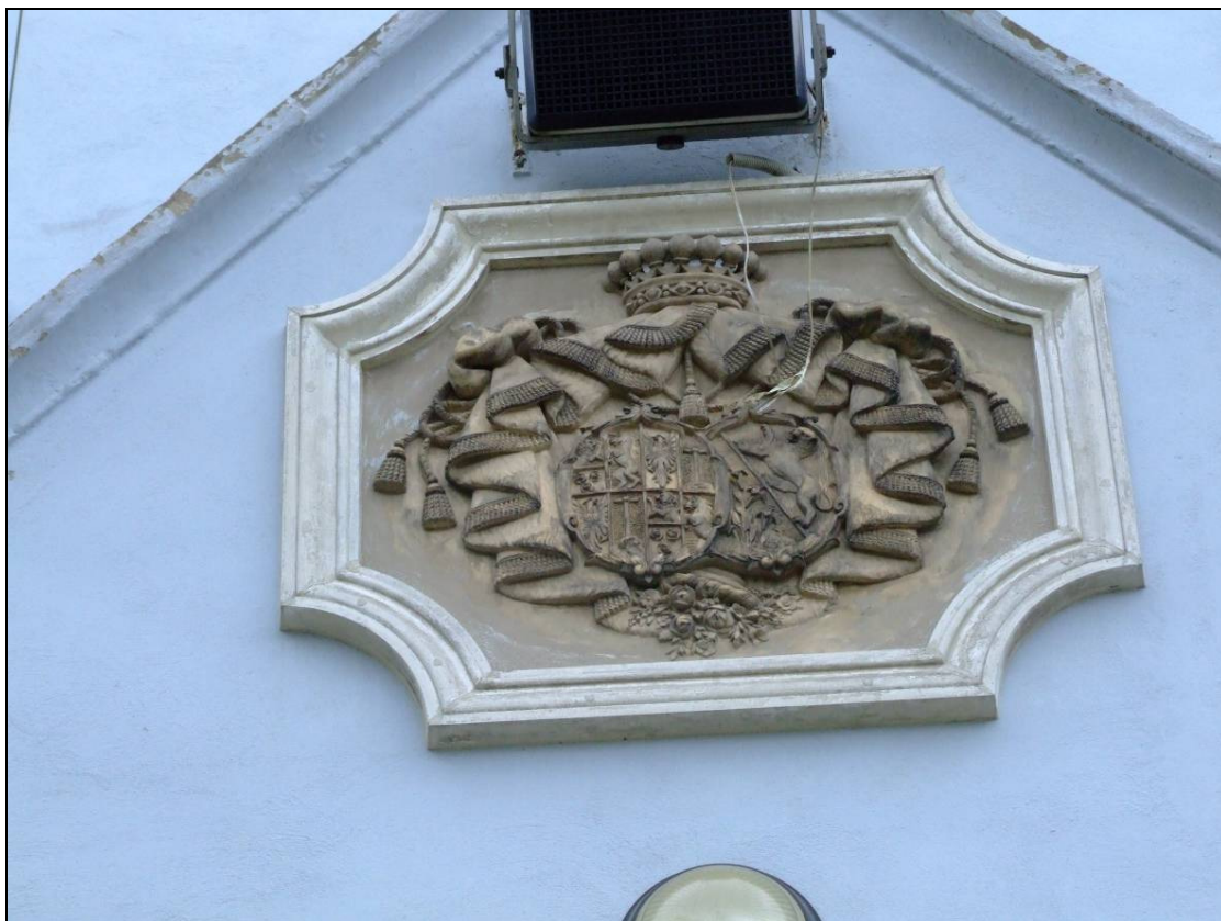
Erb rodiny Henckelovcov