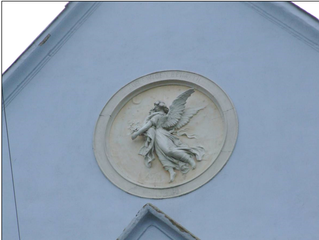
Reliéf anjela na čelnom štíte