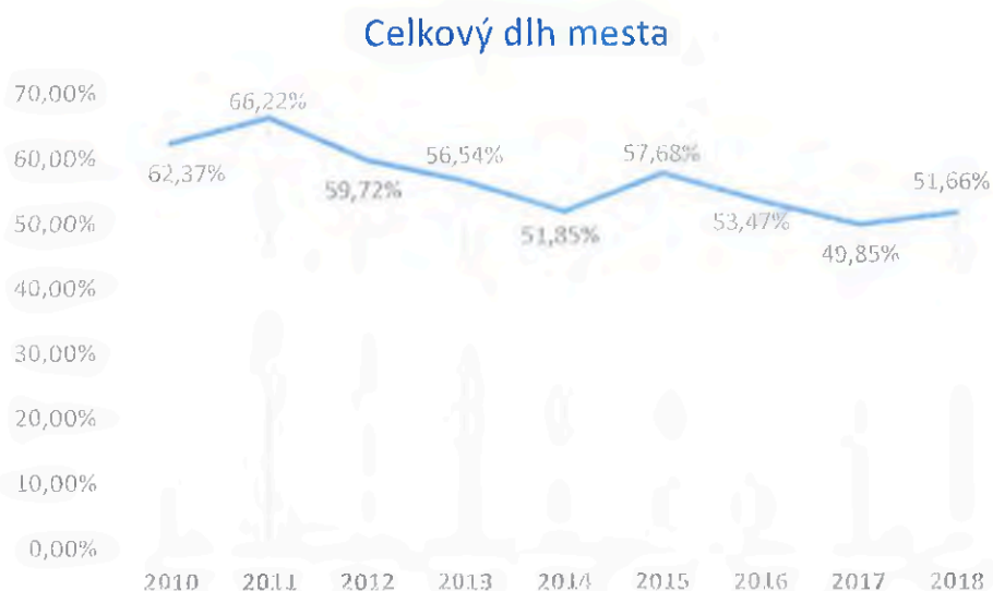
Graf č. 1 Celkový dlh mesta Bratislava

NKÚ SR na základe uvedených údajov zistil, že v rokoch 2010 – 2011 (obdobie schválenia dohôd o reštrukturalizácii dlhu v MsZ) bola zadlženosť mesta nad hranicou 60 %, čo nebolo v súlade s § 17 ods. 6 písm. a) zákona o rozpočtových pravidlách územnej samosprávy.