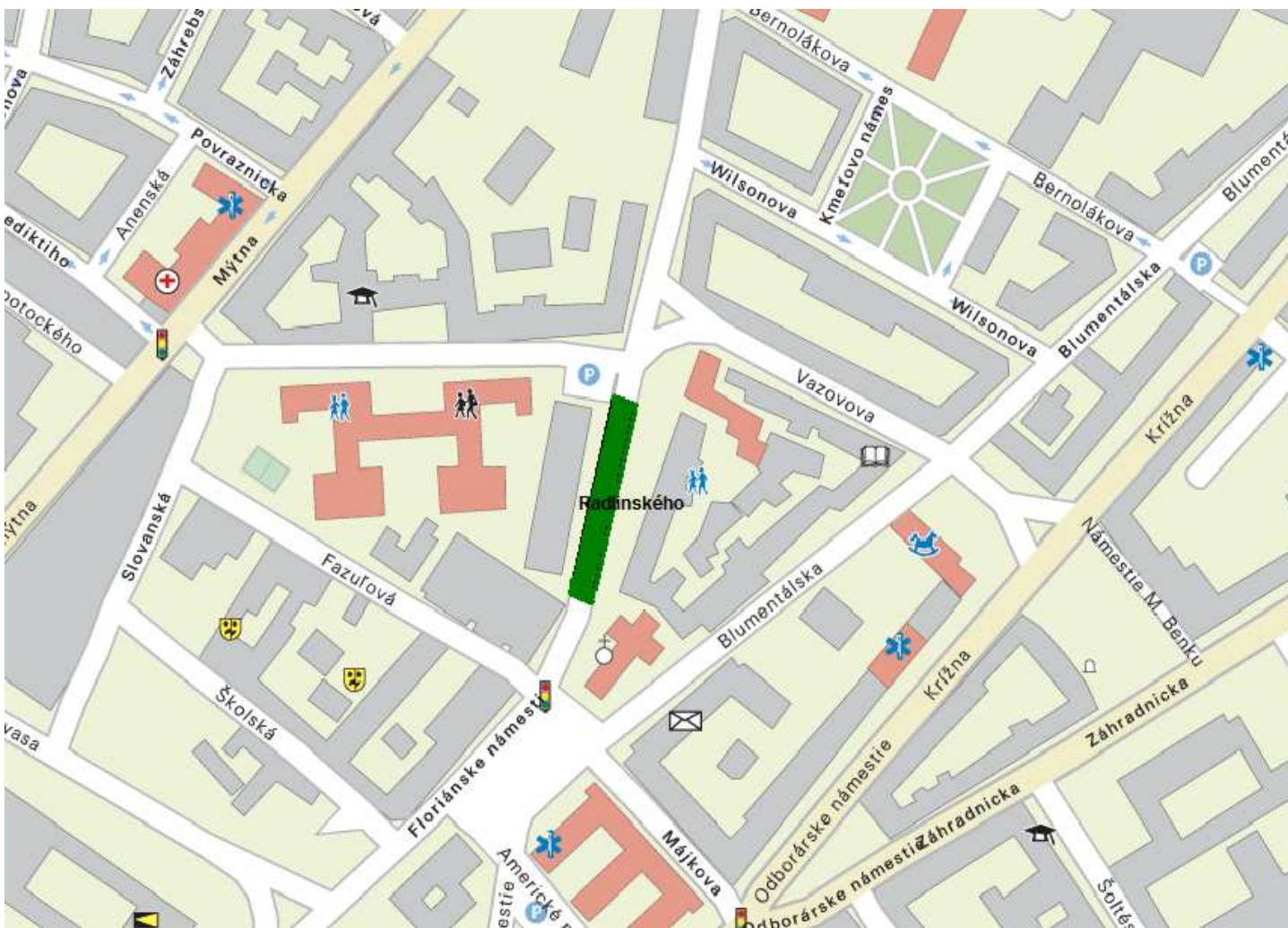
Vybudovanie prestupnej integrovanej zastávky MHD na Radlinského ulici