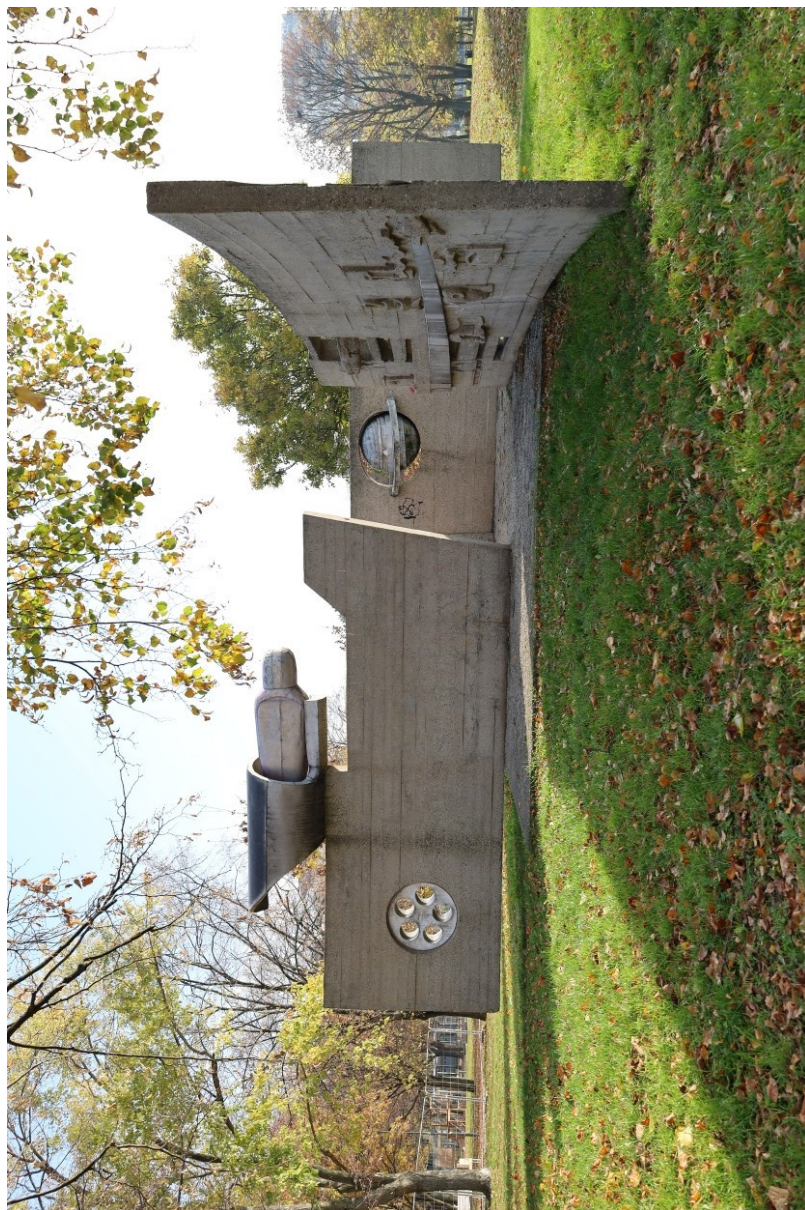
Dielo Vesmír, Račianske mýto/Mikovíniho, na pozemku registra „C“, p. č. 11903/1 v k. ú. Nové Mesto