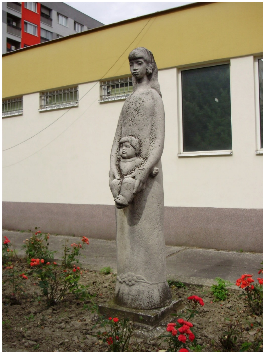
Socha Matka s dieťaťom, Karpatské námestie 9, na pozemku reg. „C“, p. č. 2875/1 v k. ú. Rača