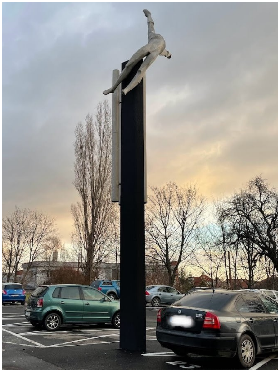
Socha Astronaut, Hečkova 18, na pozemku reg. „C“, p. č. 1606/80 v k. ú. Rača